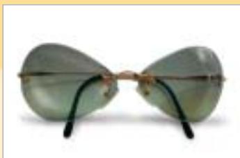
...sono troppo allungati