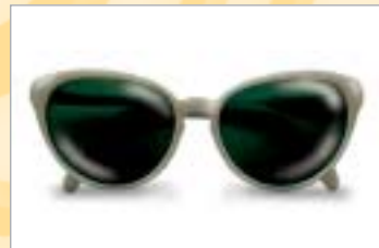
...sono di quando eri ragazza