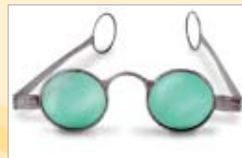
...sono fuori moda