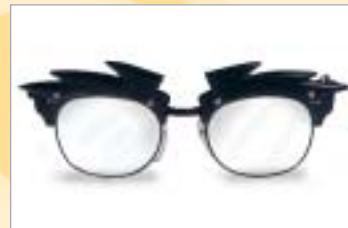
...di una forma che non ti piace più