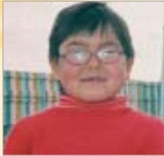
Askar Bishkek - Kirgystan