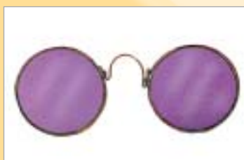
...oppure troppo tondi