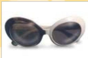
...sono troppo scuri