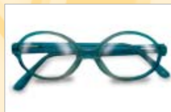
...o semplicemente non sono più adatti al tuo viso