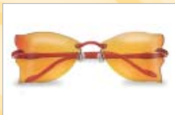
...di un colore che non ti piace più