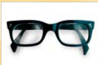
...sono troppo pesanti