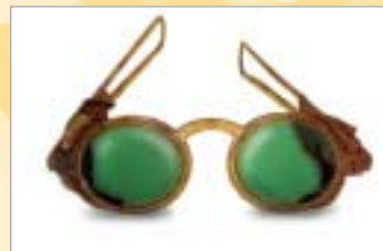
...o troppo sportivi