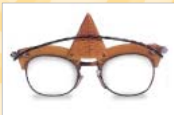
...non sono moderni